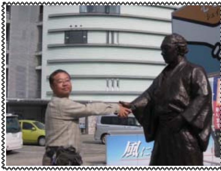
撮影：高知市 龍馬記念館にて 龍馬さんとハンドシェイクぜよ！